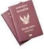
บัตรประจำตัวเจ้าหน้าที่ของรัฐ